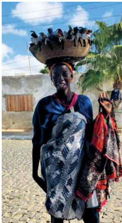
Domorodkyně se suvenýry

Další den ráno si dohodneme auto s řidičem a vyrážíme do měsíční krajiny Salu. Sopečný kráter Salinas de Pedra de Lume je přírodním úkazem, kde se do původního kráteru sopky trhlinami dostává mořská voda. Na dně kráteru se voda odpařuje a zůstává mořská sůl,