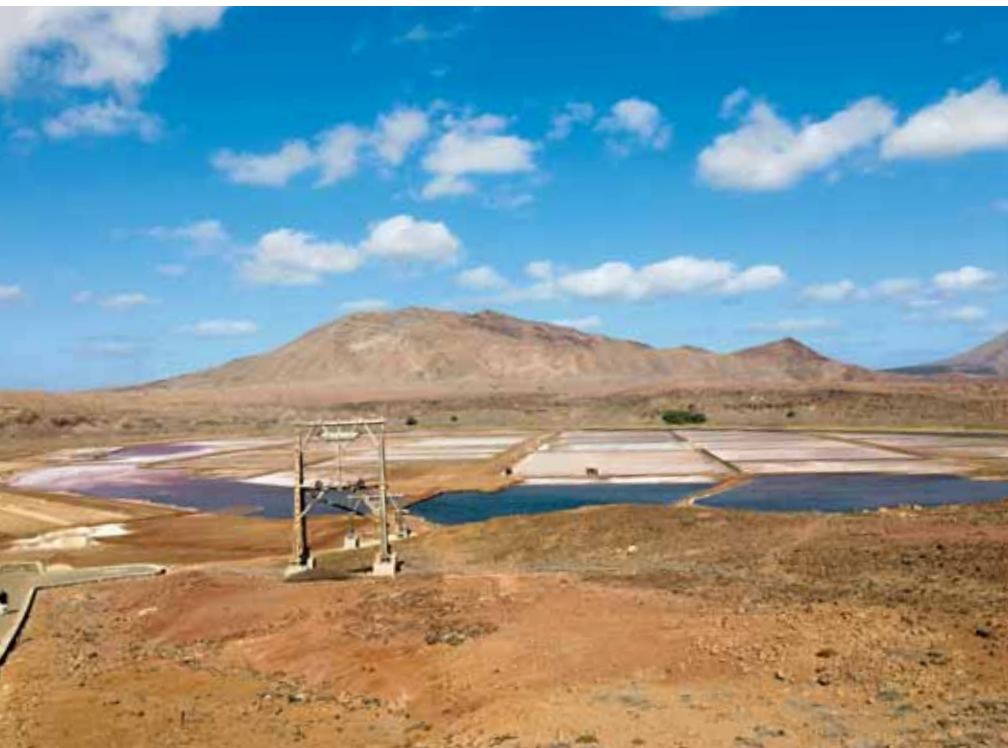
Těžba soli na ostrově Sal

je dnes muzeem, silně na nás zapůsobí. Necháme se autem vyvézt skoro až na hřeben hor a odtud se vydáme po klesající cestě s krásnými výhledy. Jakoby při návratu o sto let zpátky vypadají obydlí domorodců a jejich život. Smějí se na nás mávají, bosí běhají kolem nás. Ve dvořech hýkají osli, kvičí prasata, kohouti sedí na stromech a někde je slyšet bučení krav. Na strmých úbočích, v těžkých podmínkách vysázená kukuřice roste ve stínu banánovníků.