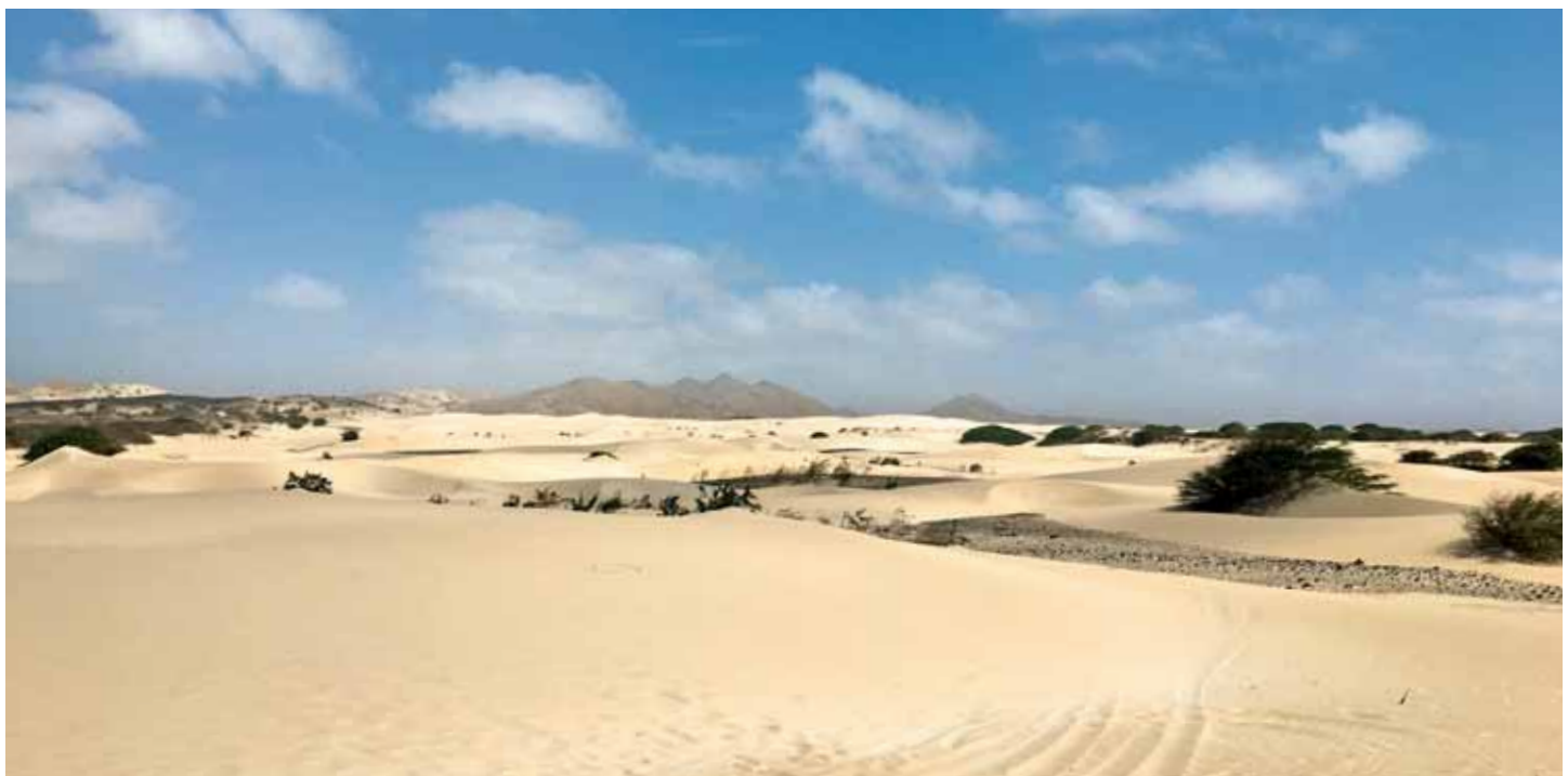
Poušť na ostrově Boa Vista