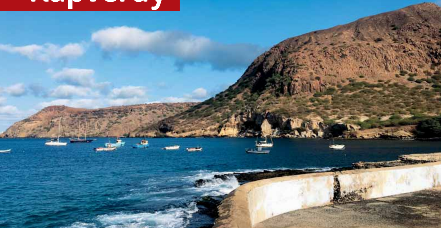
São Tiago, Taraffal

Cabo Verde nebo ostrovy Zeleného mysu. Tak se jmenuje souostroví v Atlantiku vzdálené přibližně 570 km od afrického Dakaru. 10 sopečných ostrovů a 8 menších ostrůvků na rozloze asi 4 000 km čtverečních bylo v 15. století objeveno portugalskými námořníky. Podle polohy se rozdělují na: Barlavento – návětrné ostrovy: Antao, São Vicente, Santa Luzia, São Nicolau, Sal, Boa Vista; a Sotavento – závětrné ostrovy: Maio, São Tiago, Fogo a Brava.