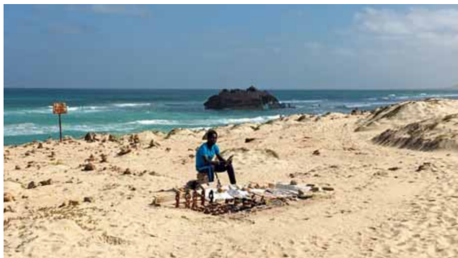
Vrak Santa Maria na ostrově Boa Vista

Spát zapřený nohama o bok lodi v kajutě během plavby na plachty a ve vlnách chce určitou rutinu. Je třeba si zvyknout na ne vždy pravidelné poskakování lodě a v takové poloze nabrat energii do služby na palubě. Východní vítr není pro nás zcela příznivý, pouze pomalu se odklání od pobřeží São Tiago, chvíli máme na kurzu ostrov Maio. Naši trasu v dálce křížuje jeden z mála trajektů, co jezdí mezi ostrovy. Vítr nám začne přát a přichází více ze severu. To nás postupně otáčí správným kurzem na Boa Vista. Služby na palubě se střídají, až přichází východ slunce. S focením tohoto vždy krásného momentu, v náklonu a skákáním přes zpěněné vlny, se trhá otež geny. Oprava nezabere mnoho času, ale už jsme všichni nahore. Během dne se u kormidla střídáme a každý dospíváme svůj deficit z předešlého dne a noci. 97mílová etapa končí na ostrově Boa Vista před plážemi Santa Monica. Zcela prázdné pláže vytvořené navátým saharským pískem z dálky oslepují svojí bílou barvou na azurovém pod-