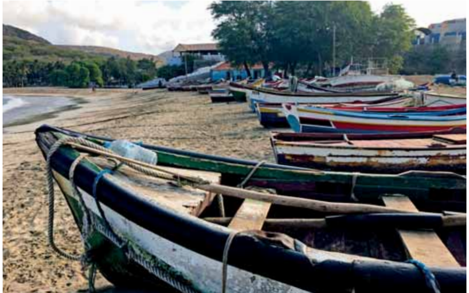
Rybáři na São Tiagu

Vstáváme brzy a ještě za tmy vytahujeme kotvu, nastavujeme kurz a pod krásnou skoro rovníkovou noční oblohou se vydáváme na víc než 100milovou etapu na ostrov São Tiago. Noční obloha na Kapverdách je zcela jiná, než jak ji známe v našich zeměpisných šířkách. Kdo se občas podívá na hvězdy a také nad nimi přemýšlí, uvidí ten rozdíl. Jiná souhvězdí, jiné planety, jiná viditelnost. Východ slunce je rychlý, bez dlouhého rozběhu. Když slunce začne